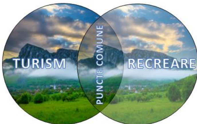
Fig. 1.2. Relația turism – recreere

De asemenea, identificarea turismului cu recreere nu este corectă, între ele există o importantă zonă de intersecție, respectiv, recreerea se realizează în cea mai mare parte prin turism, iar turismul în marea lui majoritate, înseamnă recreere (Fig. 1.2).